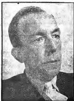
D. de Jong

brands kunstuittingen, omdat hij er zijn eigen situatie in herkent.